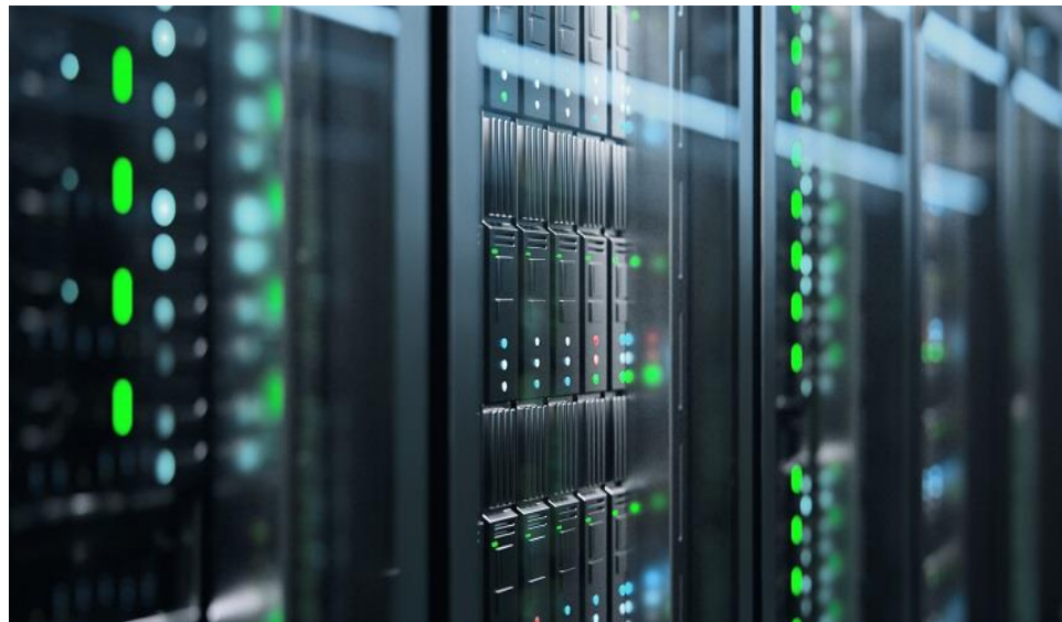
Gambar 3 Ilustrasi Disaster Recovery Center

Sebagai bagian dari optimalisasi layanan TIK di lingkungan Pemerintah Kota Pekalongan, Dinas Komunikasi dan Informatika juga membangun DRC (Disaster Recovery Center). DRC sebagai tempat penyimpanan serta pengolahan data dan informasi pada saat terjadinya bencana yang mengakibatkan Data Center yang ada mengalami gangguan temporary , sebagian atau bahkan rusak total sehingga memerlukan waktu yang lama untuk melakukan pemulihan (Firyansyah, 2015). DRC ditempatkan di lokasi yang berbeda dari Data Center, yaitu di gedung Sekretariat Daerah. DRC yang dimiliki Pemerintah Kota Pekalongan belum berfungsi secara optimal karena baru sebagian data dan aplikasi yang di backup di DRC, proses backup pun belum semuanya otomatis dan realtime . Namun demikian Dinas Komunikasi dan Informatika terus berupaya agar DRC dapat berfungsi secara optimal.