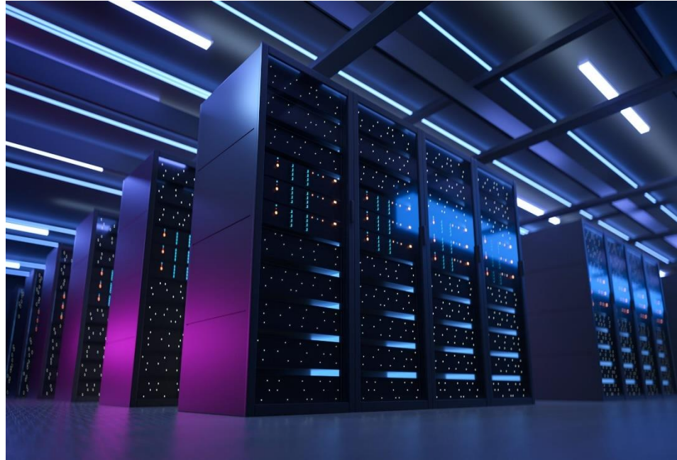
Gambar 2 Ilustrasi Datacenter BATIKNET