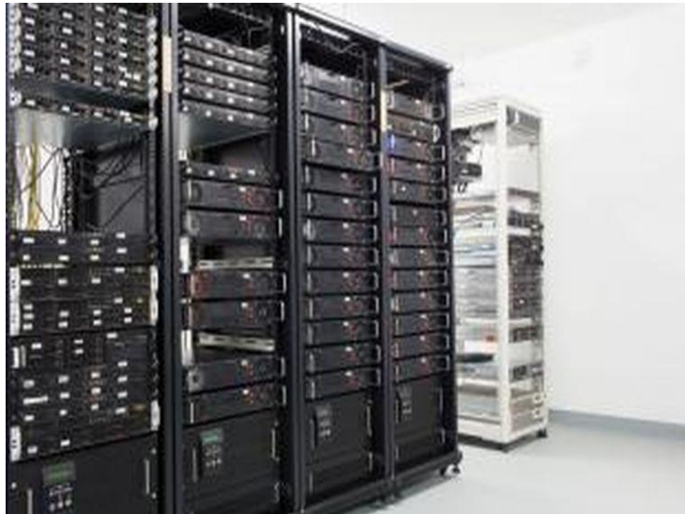
Gambar 2 Ilustrasi Datacenter BATIKNET